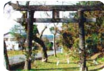
五社様の一の鳥居

を除いても12の祭りがあり、46軒あっても年に2回の当人が廻ってくる人もいる。それにここには大鳥居がある。五社様の